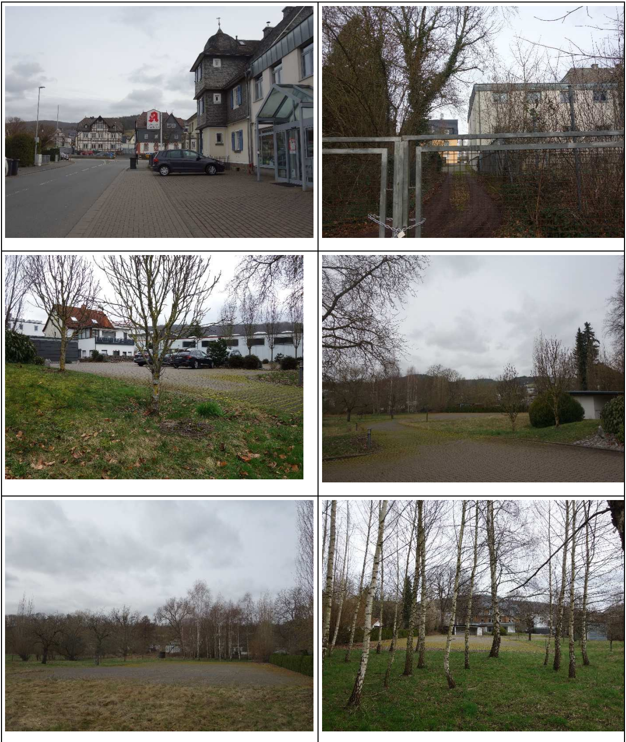
(Eigene Aufnahmen, 02/2024)