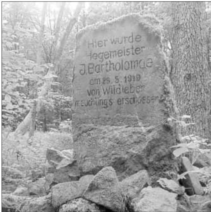
Das Foto zeigt den Gedenkstein im Sommer mit Moos bewachsen