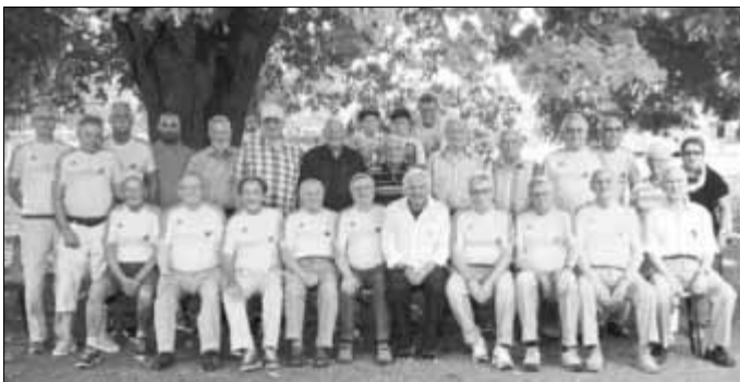
Die Ehrenmitglieder zum Teil in einem gelben Fleisbacher-Trikot, denn sie wollen nach dem Training mit „Stepi“, in der ersten Reihe Bildmitte sitzend, den Fußball-WM-Titel 2022 in Katar holen, oder sie scheiden in der Vorrunde aus