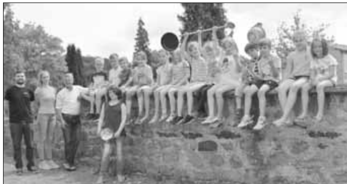
Ferienpasskinder nach dem Mittagessen

Viel Spaß hatten die Ferienpasskinder auch in diesem Jahr wieder beim gemeinsamen Kochen im JugendBISTRO. Während in der heimischen Fastfood-Gastronomie die Chicken Nuggets fix und fertig über die Theke gereicht werden, war dieses Mal Eigeninitiative gefragt. Chicken Nuggets sind mundgerecht portionierte, panierte und frittierte Stücke aus Hähnchenfleisch. Sie gehören zum Standardsortiment von US-amerikanischen Fastfood-Anbietern wie McDonald's, Burger King oder Kentucky Fried Chicken. Jetzt mussten die Kinder zunächst das Hähnchenfleisch portionieren, in Mehl und dann mit Ei und Cornflakes panieren. Andere schnitten die Kartoffeln zu Western-Kartoffeln. Neben dem Kochen war allerlei Unterhaltung im JugendBISTRO angesagt!