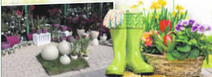
Am Sonntag sorgen für das leibliche Wohl der AGV Liederkranz Heuchelheim und das THW Gießen.

Lassen Sie sich von tollen Ideen für den Frühling begeistern und feiern Sie mit uns gemeinsam unser Frühlingsfest. Wir freuen uns auf Sie!