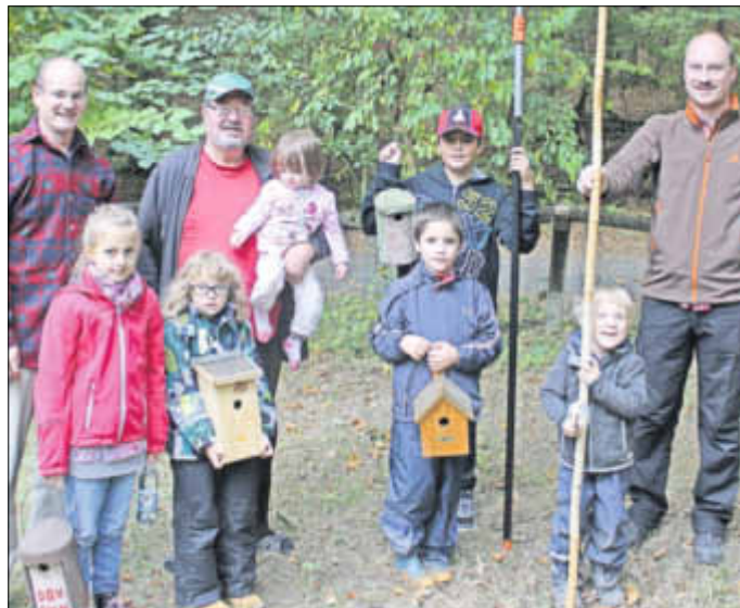
Kontakt: Michael Krenos, Tel. 540758 und www.vogelschutz-sinn.de

Wie jedes Jahr im Herbst gingen auch dieses Mal die Waldameisen wieder auf Nistkastenkontrolle. Etwa zwei Stunden dauerte die Tour von der Pirohlütte bis an den Ballersbacher Weg und hinter dem Schwimmbad wieder zurück zur Pirohlütte. Dabei kontrollierten die Kinder fast 30 Nistkästen und bestimmten die Nester. Zur großen Freude waren fast alle Nistkästen in der vergangenen Brutsaison besetzt gewesen. Schnell lernten die Kinder, wie man die Nester erkennt und konnten nach kurzer Zeit die einstigen Bewohner selbst bestimmen. Zur Nistkastenkontrolle gehört nicht nur das bestimmen der Nester, sondern auch das Überprüfen des Nistkastens auf Schäden, ggf. Nistkästen an andere Orte umzuhängen, defekte Kästen auszutauschen und zugewachsene Nistkästen freizuschneiden.