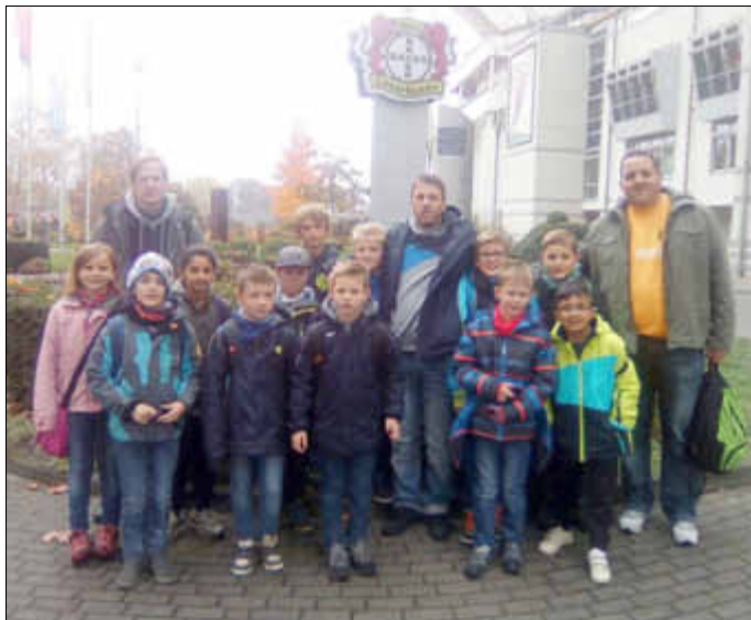
Die E3 Mannschaft mit ihren Trainern und Betreuern vor dem Eingang der BayArena.

Am Samstag, den 5.11.2016 machte sich die Mannschaft mit ihren Betreuern und Trainern auf zum Bundesligaspiel zwischen Bayer 04 Leverkusen und dem SV Darmstadt 98. Morgens starteten sie mit dem Zug in Richtung Leverkusen. Angekommen in Leverkusen verbrachte man die Zeit noch mit Torwandschießen, da man noch nicht ins Stadion konnte. Dann machte man sich auf zu den Einlasskontrollen. Nachdem alle Kinder, Betreuer und Rucksäcke strengstens untersucht wurden, machte man die Essensstände unsicher und der große Hunger wurde mit Pommes und Bratwurst gestillt. Gestärkt konnten die guten Sitzplätze eingenommen werden. Von dort aus konnte man Julian Brandt, Bernd Leno und Co. beim Warmlaufen gut beobachten. Die erste Halbzeit stand an und man konnte das 1:0 für Leverkusen sehen. In Halbzeit zwei fielen weitere vier Tore und somit endete das Spiel mit 3:2 für Leverkusen. Dann traten alle gemeinsam wieder die Heimreise mit dem Zug an. Leider hatte man in Köln einen längeren Aufenthalt, dieser wurde mit Abendessen bei McDonalds dann doch noch sehr kurzweilig verbracht. Somit kehrten alle gegen 22.30 Uhr wieder in Herborn zurück. Für viele Kinder war es toll, auch mal als Zuschauer ein Spiel zu sehen. Die Mannschaft würde sich freuen, Sie auch als Zuschauer einmal begrüßen zu dürfen. Bislang steht sie ungeschlagen auf dem 1. Platz der Kreisliga der E Junioren. Anstoß ist am Freitag, den 11.11.2016 um 17.00 Uhr auf dem Fleisbacher Sportplatz. Gegner ist die Mannschaft des SV Niederscheld.