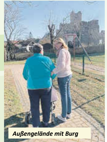
Außengelände mit Burg

Da, wo andere Urlaub machen, verbringen Sie einen oder mehrere Tage in der Seniorentagespflege. Transportservice in modernen Bussen , Frühstück, Mittagessen, Kaffee und Kuchen inklusive. Die gesamte Einrichtung ist ebenerdig und barrierefrei.