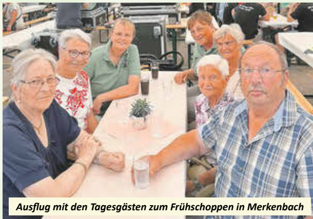
Ausflug mit den Tagesgästen zum Frühschoppen in Merkenbach

Der große Gemeinschaftsraum, 3 Ruheräume und 2 Pflegebäder schaffen eine angenehme Atmosphäre mit Wohlgefühlcharakter. Unsere schöne Außenanlage im Zeichen der Burg , lädt zum Sonnenbad ein oder relaxen im Schatten der Kastanie und der Rundgang zur Erhaltung der Fitness.