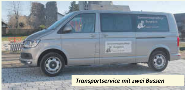
Transportservice mit zwei Bussen

Greifenstein, Lustgarten 5a • www.seniorentagespflege-greifenstein.de