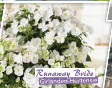
Runaway Bride Girlanden-Hortensie