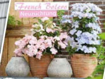
French Bolero Neuzüchtung