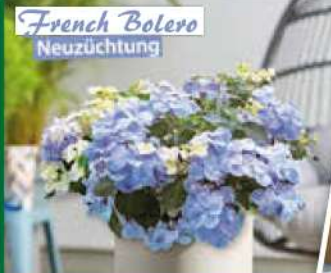
French Bolero Neuzüchtung