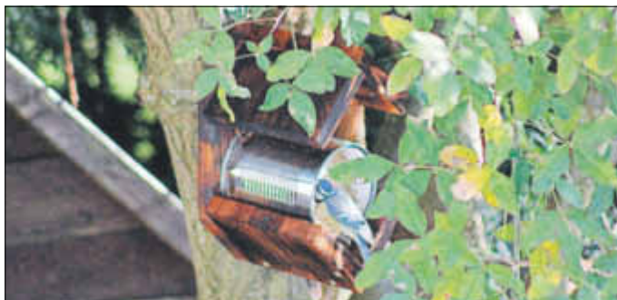
Eine Blaumeise sättigt sich an einer Fettfutterdose

Die Temperaturen sinken nun nachts unter den Gefrierpunkt. Zeit, das Futterhaus im Garten, auf dem Balkon oder der Terrasse aufzubauen. Ein klassisches Futterhaus sollte regelmäßig sauber gehalten werden, damit er nicht zum Hotspot für die Verbreitung von Krankheiten wird. Zu empfehlen sind auch Futterspender zum Aufhängen, bei denen die Vögel nicht im Futter sitzen, sondern von der Seite herauspicken können. Fettfutterbüchsen gibt es bei unserer Vogel- und Naturkundewartin Evelyn Krenos, Tel. 53512