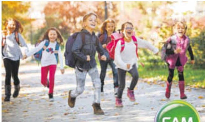
EAM-Stiftung 2021: Erziehung und Bildung sind in diesem Jahr ein Themenschwerpunkt.

Sie engagieren sich in einem Verein für Kindergärten oder legeschwache Grundschüler? Sie betätigen sich im Förderverein eines wissenschaftlichen Instituts? Oder Sie unterstützen in Not geratene Menschen in einer Selbsthilfegruppe oder durch Ihre Arbeit für eine Tafel? Dann ist Ihre Bewerbung bei der EAM-Stiftung