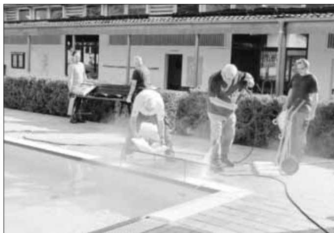
Archivfoto Vorbereitungen für Badesaison

Dennoch konnte im Laufe der Saison eine große Investition umgesetzt werden: Ein neues Dach und eine Solaranlage auf der großen Halle. Die Finanzierung war glücklicherweise schon vor Corona in trockenen Tüchern. Die Solaranlage konnte vollständig mit Spendengeldern in Höhe von ca. 13.000 Euro bezahlt werden. Ein großer Dank gilt hier allen, die einen Beitrag dazu geleistet haben. [...nächste Woche geht es weiter im Text!]