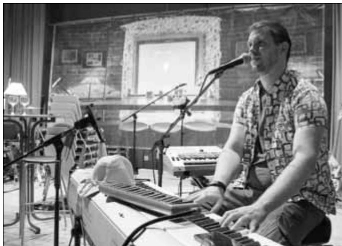
Einblick in die Proben

Tickets sind im BeZett, Jahnstraße 1, 35764 Sinn oder online unter https://www.deinetickets.de/event/prallesleben/ zum Preis von 10,--€ für Erwachsene und 7,--€ ermäßigt sowie an der Abendkasse erhältlich. Weitere Informationen finden sich unter www.pralles-leben.com .