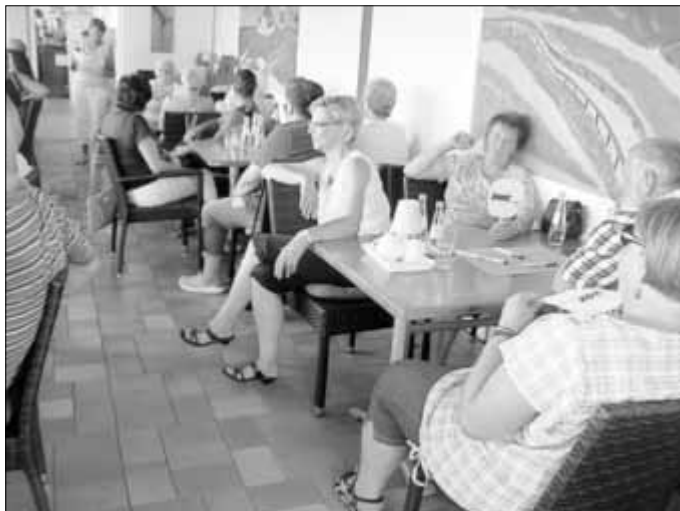
Gruppenbild bei der Veranstaltung

Wie der Vorsitzende berichtet sind die Mitgliederzahlen, wie schon seit vielen Jahren, weiter steigend. Damit liegt der Ortsverband im Trend von Kreis- und Landesverband.