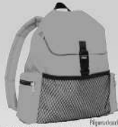
Pilgersack Sammelbeut 98, Deutscher Kirchentag in Bielefeld

Herzliche Einladung! Wir freuen uns, mit dir/ euch am 2. September unterwegs zu sein!!!