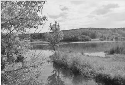
Rundweg Niederweidbach - Aartalsee

Beginn: um 10 Uhr mit einer Andacht in der Ev. Kirche in Niederweidbach.