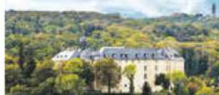
Großes Schloss Blankenburg