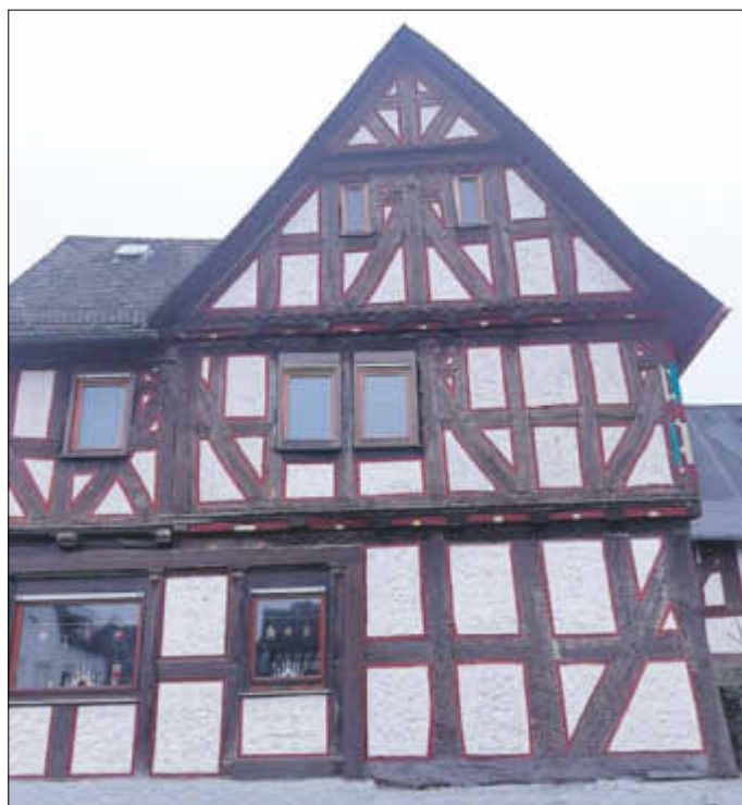
Fassade an der Straßenseite mit dem „Wilden Mann“