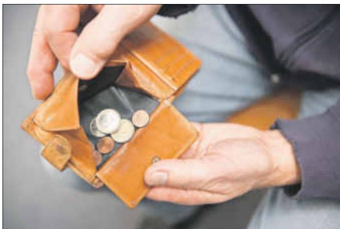
Von der Zuzahlung bei Medikamenten können sie sich bei Ihrer Krankenkasse befreien lassen

Eilige Anzeigen per E-Mail aufgeben: anzeigen@wittich-herbstein.de