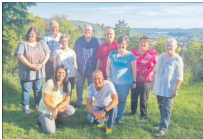
Der neue gewählte Vorstand des VdK Ortsverband Fleisbach