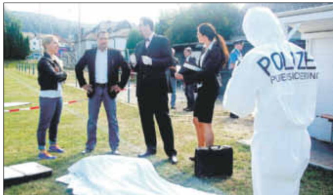
Ermittlungsfall „Sportplatz-Leiche“: (von links) Kommissarin Scheffler (Ines Wittig), Kommissar Zimmermann (Jochen Niedermayer), Rechtsmediziner Dr. Wagner (Jörg-Michael Simmer), Oberstaatsanwältin von Kutsow (Sabine Azizi) sowie Ermittler und Zeugen.

Einlass ist ab 19.30 Uhr. Die Eintrittskarten zum Preis von 8 Euro gibt es ausschließlich über den Förderverein des Sinner Waldschwimmbads - entweder online ( www.waldschwimmbad-sinn.de ), im Vorverkauf live am Eingang des Bades oder an der Abendkasse. Noch ein Hinweis der Veranstalter: Bei Regen, Gewitter oder Sturm kann die Veranstaltung nicht stattfinden. Außerdem gelten natürlich die aktuellen Corona-Bestimmungen.